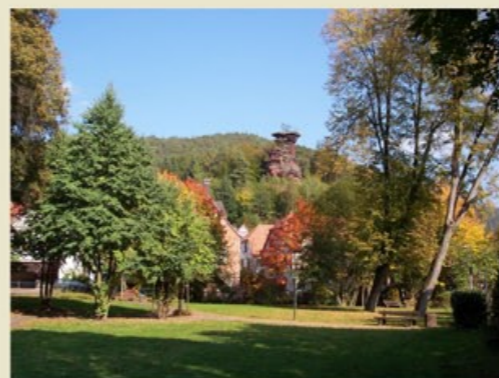
Dorpspark met blik op de Rappenfelsen (Ravenrots)

Hinterweidenthal is buitengewoon geschikt als uitgangspunt voor korte of lange fietstochten. Bijvoorbeeld het Duits-Franse PAMINA fietspad Lautertal, de Pfälzer Woudtocht of het Pirminius-fietspad.